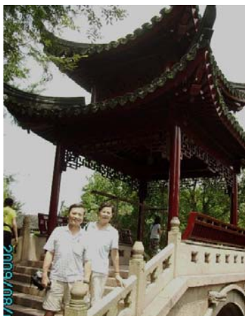
作者夫婦攝於「大觀園」內寶玉、「大觀園」花園一景 黛玉、寶釵常遊玩的亭