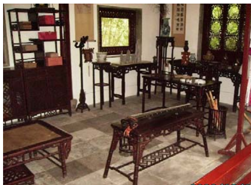
瀟湘館一角(可看到黛玉所彈的古琴)

這一形像的創新性。至於這究竟是什麼個形象，由於故事極其錯綜複雜曲折，有人認為林黛玉優柔寡斷、弱不禁風、心胸狹窄、愛使小性兒，而寶釵端莊穩重，溫柔敦厚，豁達大度。有人則認為，寶釵性冷無情，虛偽奸險，是個「女曹操」。同一人物形像，竟然有截然相反的看法，固然仁者見仁、智者見智的，同時也說明這一形像的複雜性、豐富性和描寫的主觀性。歷來有不同的看法，至今沒有定論。我個人覺得，暫不論什麼文學評判、心理學分析的大道理，單就一個市井小民來說，「願有情人終成眷屬」。