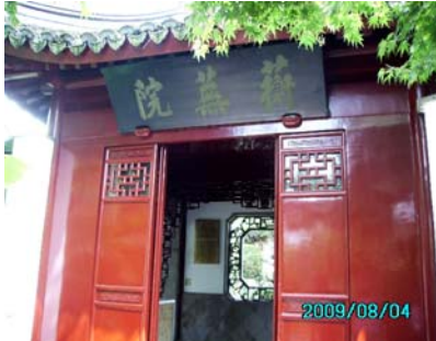
薛寶釵居住的蘅蕪院