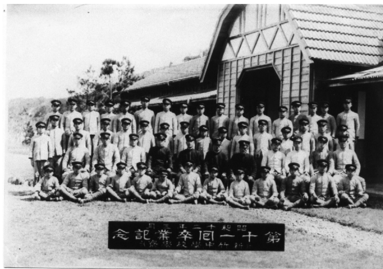
11回部作同學攝於學寮